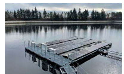
První plovoucí fotovoltaická elektrárna v ČR (testovací fáze)

V současné době nás čeká malá, ale hezká akce v podobě opravy převozní lodě SKALKA, která bude od léta převážet v Ústeckém kraji cyklisty a návštěvníky Národního parku České Švýcarsko.