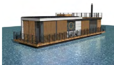
Vizualizace luxusního hausbótu

V současné době nás čeká malá, ale hezká akce v podobě opravy převozní lodě SKALKA, která bude od léta převážet v Ústeckém kraji cyklisty a návštěvníky Národního parku České Švýcarsko.